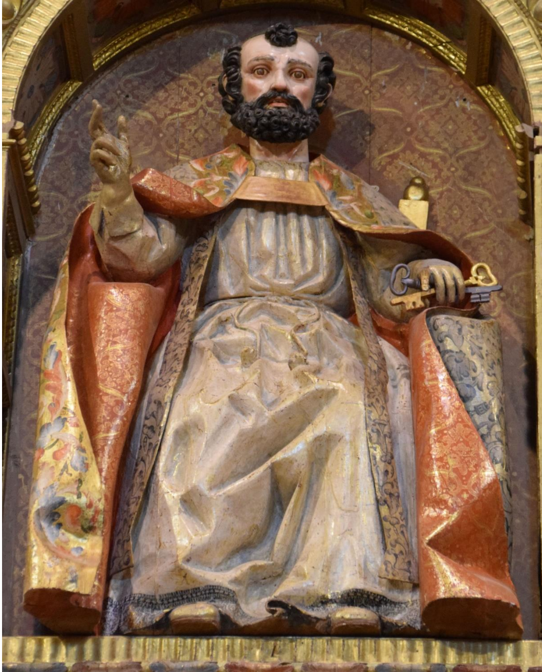
Fig. 8: San Pedro en cátedra , Andrés de Oliveros, 1664. Iglesia de San Pedro, Itero de la Vega (Palencia).

María Magdalena y Asunto desconocido ) y en el superior una hornacina con un santo ( Santa María Magdalena y San Antonio de Padua ); y un potente ático de remate semicircular constituido por una gran portada central con el Calvario y flanqueada por sendos escudos del obispo Piña Hermosa tocados por un capelo con cuatro borlas dispuestas en dos órdenes a cada lado.