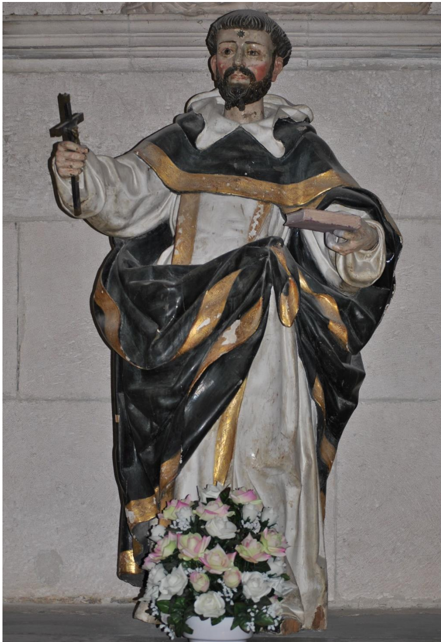
Fig. 14: Santo Domingo , Vicente Díez, 1698. Convento de San Pablo, Peñafiel (Valladolid).

Artillería Francisco de Rojas Iradier (Valdivieso, 1975: 154). Se trata de una estimable escultura que representa al santo de pie, portando un libro cerrado y un Crucifijo que sustituye a un desaparecido báculo. Viste el hábito bicolor de su orden, túnica y escapulario blancos y manto negro, prendas enriquecidas por unas orlas doradas en los bordes. La cabeza, coronada por una tonsura, aún pregona el estilo impuesto por Fernández décadas atrás, con su característica barba bífida. En la frente exhibe una estrella que alude a la que apareció en los cielos el día de su bautismo. Con respecto a las condiciones diseñadas por Díez, Santo Domingo ha perdido el resto de los atributos, incluido el perro recostado a sus pies que portaba entre sus fauces una antorcha encendida y que hace referencia al nombre “dominicanos” (Domini canis: los perros del Señor).