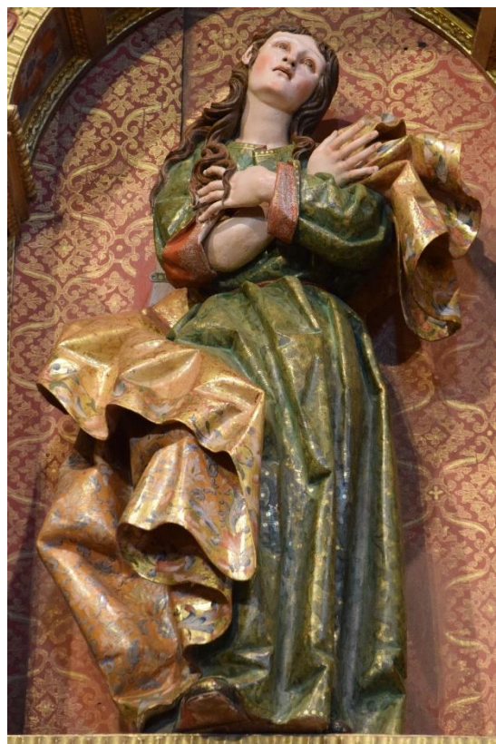
Figs. 9 y 10: San Antonio de Padua y Santa María Magdalena , Andrés de Oliveros, 1664. Iglesia de San Pedro, Itero de la Vega (Palencia).