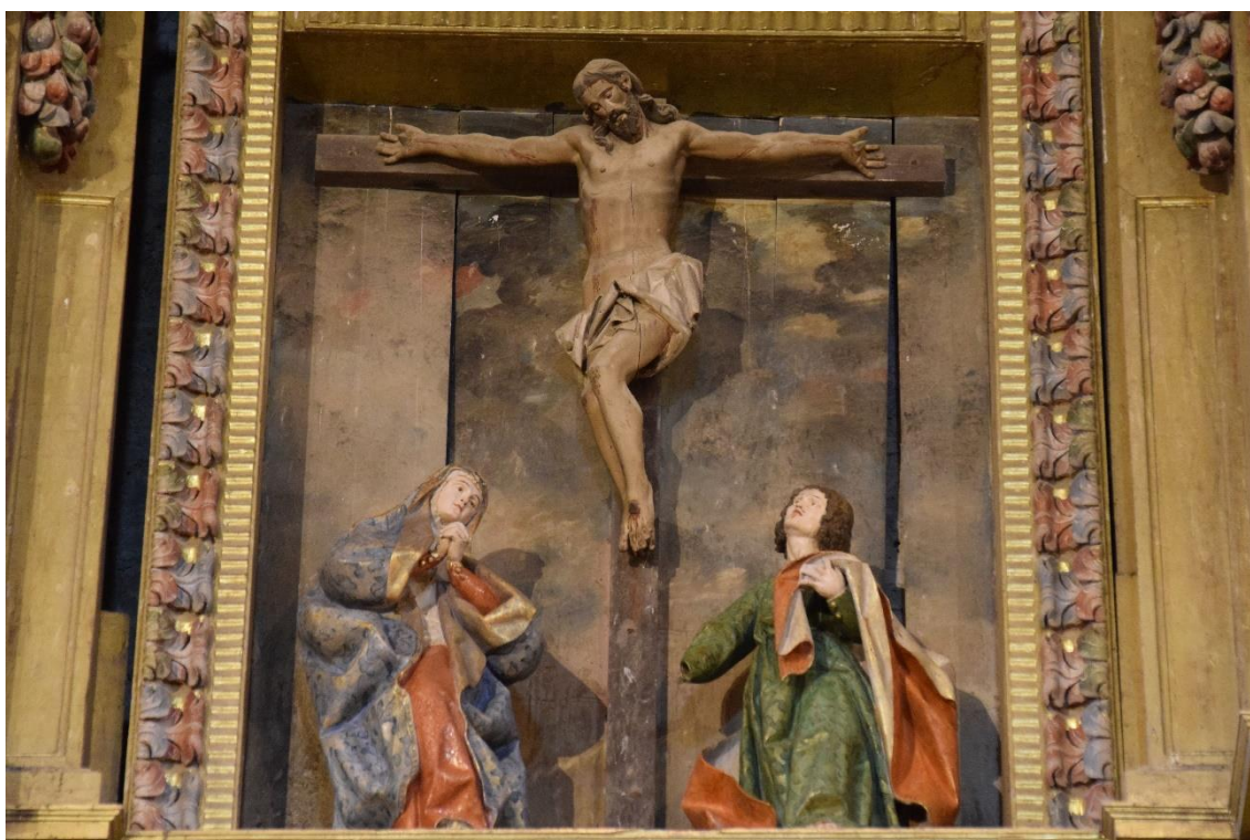
Fig. 11: Calvario , Andrés de Oliveros, 1664. Iglesia de San Pedro, Itero de la Vega (Palencia).

Por su parte, el Calvario ( Fig. 11 ) también constituye una imitación de los creados por Fernández, aunque sus figuras son un tanto más envaradas y corpulentas. Destaca el estilizado Crucificado dispuesto en una posición excesivamente forzada. La última imagen conservada del conjunto es el relieve de la Resurrección de la portada del tabernáculo, pues las de San Pedro y San Pablo que le flanqueaban han desaparecido, cuya composición estará inspirada en algún grabado, aunque el resultado es un tanto decepcionante a causa de la defectuosa plasmación de la perspectiva.