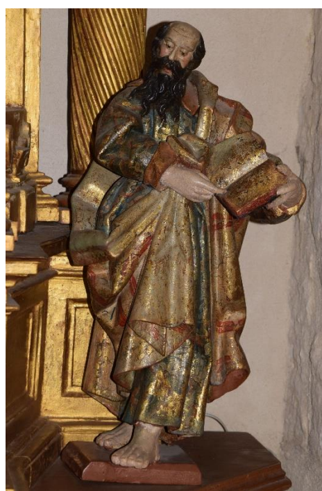
Figs. 4 y 5: San Pedro y San Pablo , Francisco Díez de Tudanca (atribuidos), h. 1671. Iglesia de Nuestra Señora de la Expectación, Peñaflor de Hornija (Valladolid).