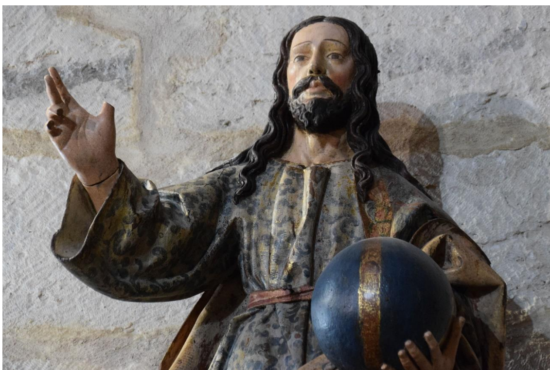
Fig. 3: El Salvador , Francisco Díez de Tudanca (atribuido), h. 1650. Iglesia de Nuestra Señora de la Expectación, Peñaflor de Hornija (Valladolid).

Cristo Salvador, San Pedro y San Pablo (ca. 1671). Iglesia de Santa María de la Expectación. Peñaflor de Hornija (Valladolid)