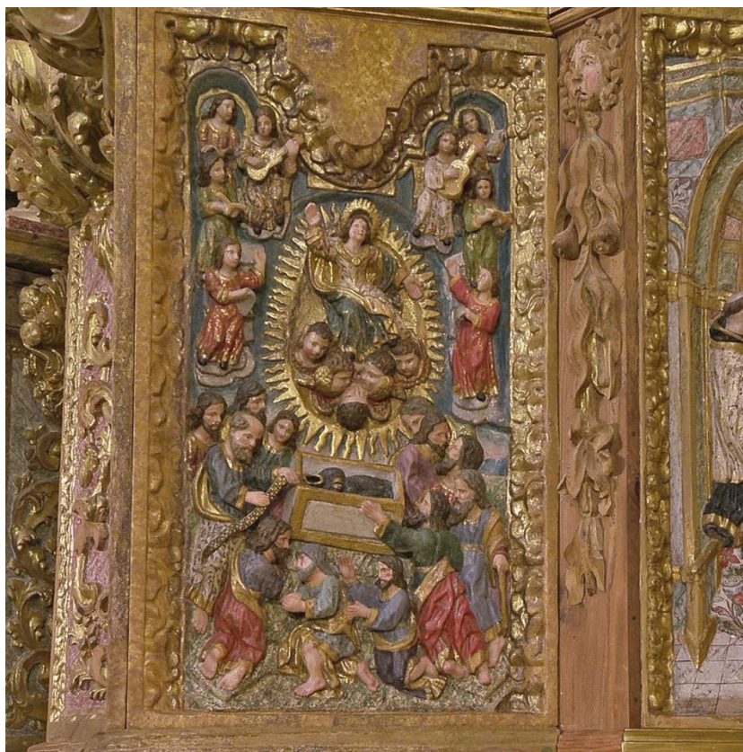
Fig. 10: Banco o predela , del retablo de la iglesia del del antiguo convento de San Agustín (hoy Santuario de la Virgen de la Loma, 1712.