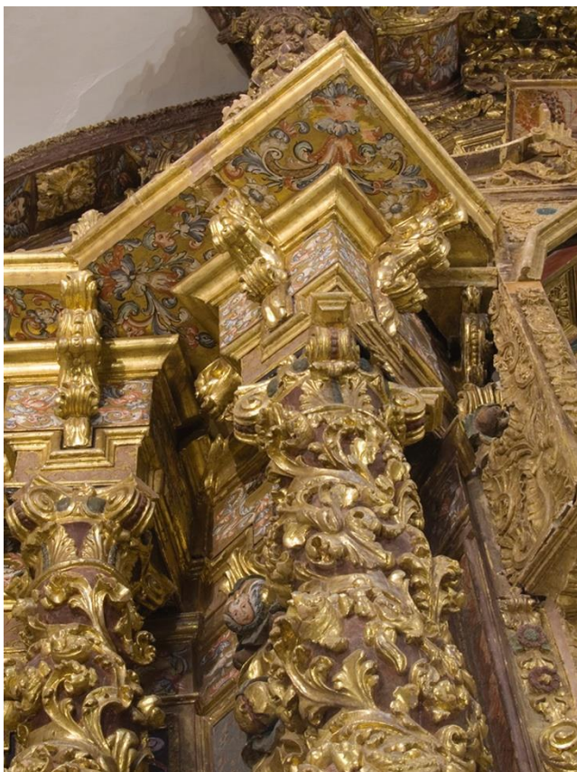
Fig. 7: Detalles de la cornisa , iglesia del del antiguo convento de San Agustín (hoy Santuario de la Virgen de la Loma), 1712.

excepcional para la época, y está también profusamente decorado con talla en relieve de motivos vegetales.