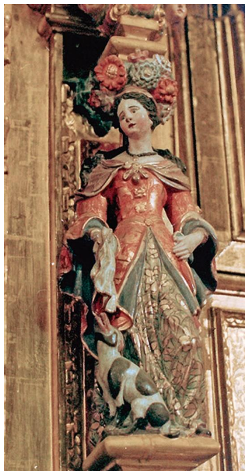
Fig. 9: Cariátide , retablo de la iglesia de Cenizate. Marcos Evangelio, primer cuarto del siglo XVIII.