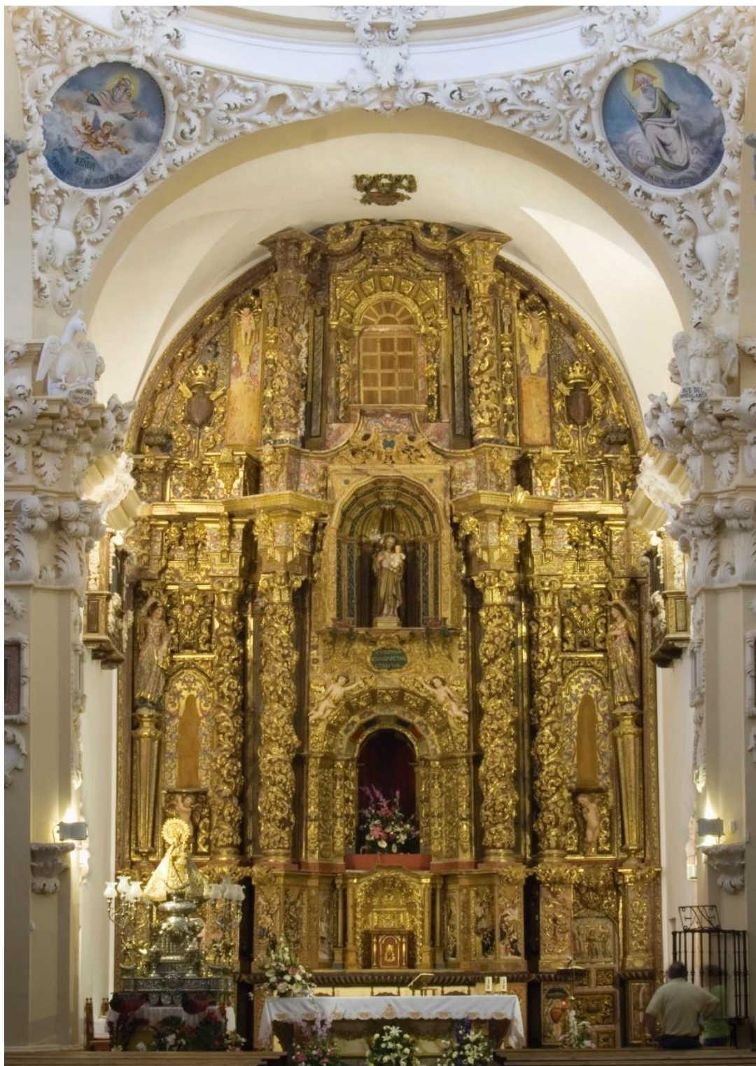
Fig. 4: Retablo mayor , iglesia del antiguo convento de San Agustín (hoy Santuario de la Virgen de la Loma), 1712.

hornacina para la imagen de San José. En las calles laterales ángeles tenantes sostenían a sendas figuras de bulto redondo que no se han conservado ( Fig. 4 ).