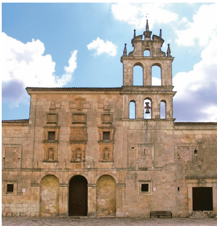
Fig. 1: Fachada del antiguo convento de San Agustín (hoy Santuario de la Virgen de la Loma), Campillo de Altobuey, Cuenca. Siglo XVIII.

El convento es un cuadrado de cuarenta y tres metros de lado, con una buena fachada de sillares. En la actualidad toda la obra que no corresponde a la iglesia se ha transformado en una plaza de toros con lo cual no quedan restos del claustro, las celdas y otras dependencias monásticas. A la izquierda encontramos la fachada de la iglesia en la que se encuentra el retablo, el resto del largo muro se corresponde con la actual plaza de toros, conservándose los vanos de las ventanas de las antiguas dependencias. La arquitectura del convento corresponde a las directrices de la arquitectura conventual española, codificada por Fray Lorenzo de San Nicolás, el gran arquitecto agustino, en su Arte y Uso de Arquitectura . Se trata de un convento de un solo claustro con iglesia de crucero marcado, de nave única con capillas entre los contrafuertes y testero recto. La nave central de la iglesia y los brazos de crucero presentan igual anchura, de modo que la cúpula que cubre el crucero tiene base circular.