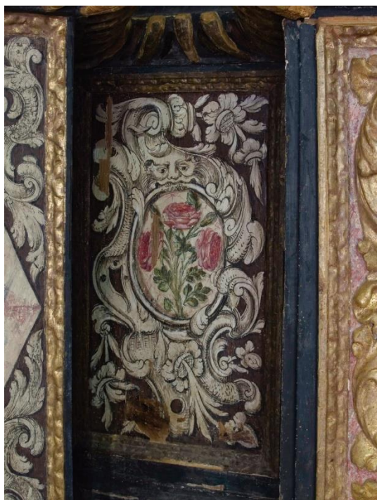
Figs. 5 y 6: Predela/banco del retablo, y detalle de la decoración del panel del fondo de una de las embocaduras del sotobanco. Iglesia del antiguo convento de San Agustín (hoy Santuario de la Virgen de la Loma), 1712.