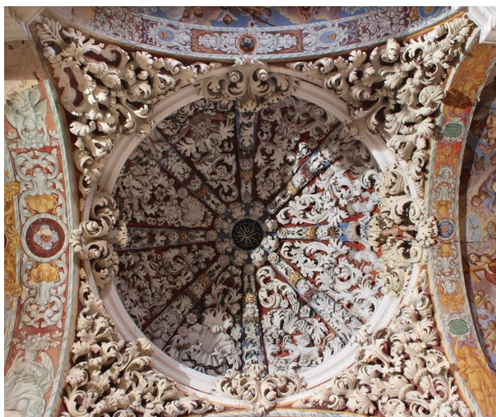
Figs. 2 y 3: Cúpulas , iglesia del del antiguo convento de San Agustín (hoy Santuario de la Virgen de la Loma, siglo XVIII) y capilla Virgen del Rosario, Basílica Villanueva de la Jara), Cuenca. Siglo XVIII.