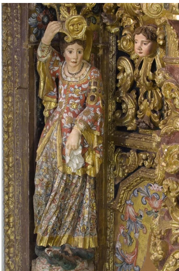
Fig. 8: Cariátide del retablo del Santuario de la Virgen de la Loma, 1712.

Esta segunda peculiaridad hizo que lo que tenía que ser una simple descripción para una extensa memoria de restauración, se convirtiera en una investigación artística. El empeño en encontrar un modelo iconográfico para estas cariátides hizo que las labores de investigación se alargaran. Tras muchas búsquedas infructuosas se halló un artículo en una revista local (Valera Honrubia, 2003: 41-58) que hacía referencia a un pequeño retablo con figuras antropomorfas de cuerpo entero como soportes. Al ver las fotografías no hubo dudas, las similitudes son evidentes. Se trataba del retablo de San Esteban de Cenizate, atribuido por Luis G. García-Saúco Beléndez (García-Saúco Beléndez, 1984, 5: 21-23) a Marcos Evangelio por similitudes estilísticas con el retablo de San Blas de Villarrobledo, de autoría conocida.