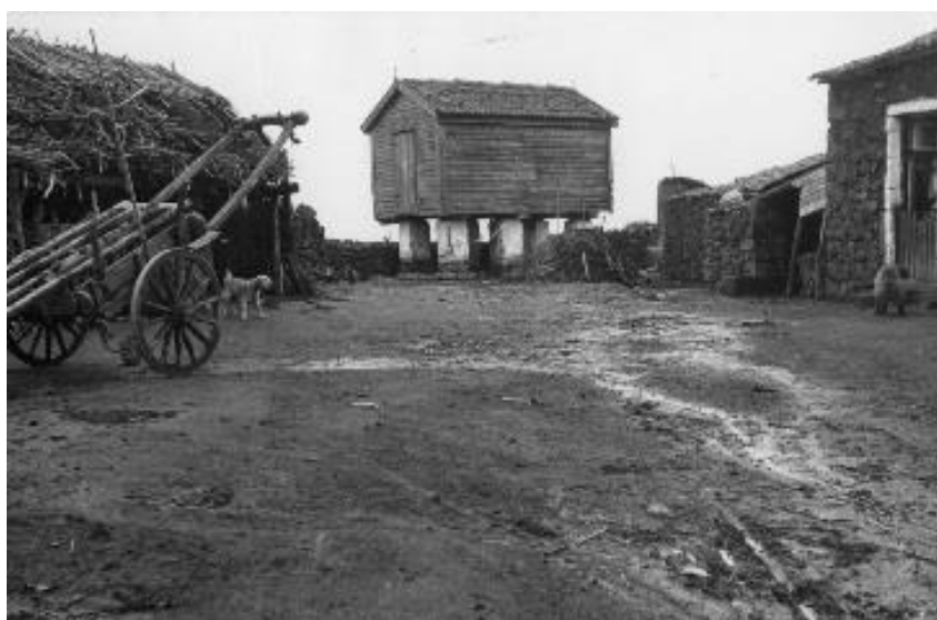
Fig. 6. O polim ou granel fechado. Pode ler-se: “Pátio lateral de uma casa nos Arrifes; Ponta Delgada, S. Miguel”.

Surgem também os granéis ou polins que são na verdade edifícios de apoio à actividade agrícola traduzindo-se em simples celeiros com o intuito de guardar os produtos da terra. Os abertos apresentam-se num volume paralelepípedo, cuja estrutura é composta por uma armação de varas dispostas ao alto, sobre um estrato de madeira suportado por barrotes apoiados em pequenos pilares de pedra ou de alvenaria (Arquitectura, 2000: 174). Mais frequentes nas casas consideradas de “gente amanhada” 8 , estava também presente o polim , nomeadamente o granel 9 fechado. Aparecem de volume semelhante ao granel aberto obrigando à abertura de vãos e à colocação de uma pequena escada de acesso pois também estão sobreelevados do chão (Arquitectura, 2000: 176) Surgem como pequenas casinhas de duas águas, telhadas e de paredes de madeira, revestidas por um escamado de tábuas (Fig. 6).