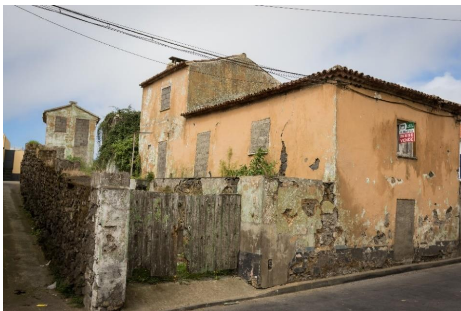
Fig. 8. Casa na Rua dos Afonsos com janela e porta na fachada. Apresenta o polim ao fundo de pedra. Repare-se na antiga falsa que evoluiu para um novo compartimento sobre a cozinha.

Estas casas estavam habitualmente associadas a proprietários rurais de média dimensão. Nos Arrifes, local de transição entre o centro urbano de Ponta Delgada e as freguesias mais afastadas, algumas lojas foram transformadas em pequenos espaços de comércio, o que justifica que determinadas casas desta tipologia apresentassem na fachada janela e porta, ao invés das suas congéneres de duas janelas ( Fig. 8 ) (Arquitectura, 2000: 545).