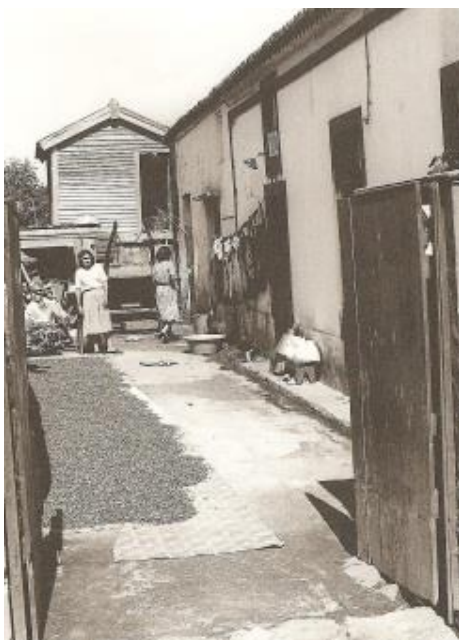
Fig. 4 - Eira. Arquitectura, 2000: 141.