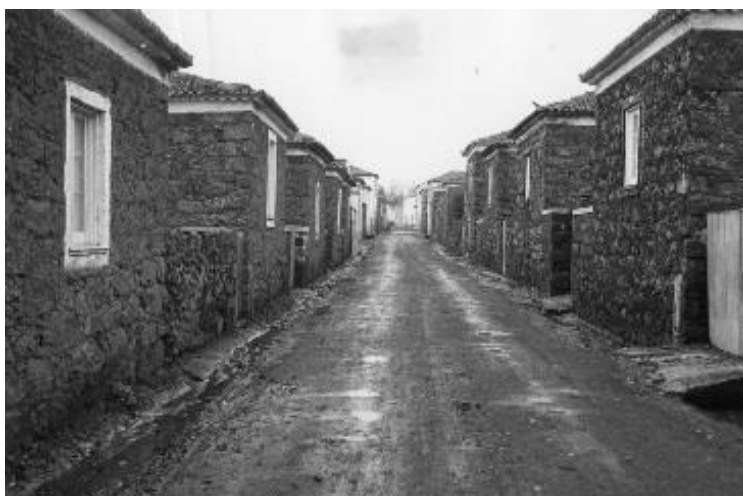
Fig. 2. Casas tradicionais dos Arrifes. Na legenda da imagem pode ler-se: “Casas rústicas. Bairro cubista nos Arrifes, Ponta Delgada, S. Miguel”. É possível que se trate da Rua Amaro Dias a meados da centúria passada. Foto: cedida gentilmente pelo Museu Carlos Machado. Arquivo Fotográfico MCM (sem data).

Numa sociedade marcada por um profundo contraste socioeconómico, desde o primeiro século de povoamento, é natural que a arquitectura habitacional traduzisse esta realidade e disparidade de rendimentos vividos pela população.