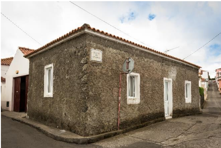
Fig. 3. Casa no Beco do Amaral, de tipologia janela-porta-janela. Foto: Cláudio Pacheco, 2018.

Na freguesia existiram ruas inteiras de casas lineares, quase sempre de duas águas, edificadas perpendicularmente às ruas, paralelas umas às outras (Brito, 2004: 191), separadas pelas eiras . A fachada encontrava-se na lateral, com empena voltada para a rua e ostentava uma porta, ladeada por janelas ou possuía duas portas e janela. Uma das portas abre directamente para a cozinha e a central para o quarto do meio da casa. ( Fig. 3 ).