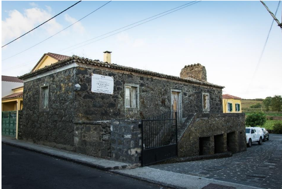
Fig. 7. Casa na Rua da Carreira. Foto: Cláudio Pacheco, 2018.

investigação ocorreram inúmeras demolições sendo difícil encontrar um exemplar fidedigno da casa popular arrifense em bom estado de conservação (Fig. 7).